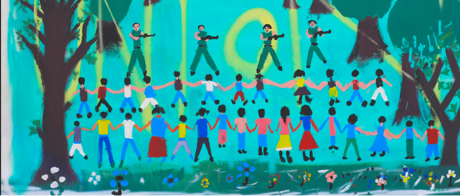
Image: Union . Oeuvre de la communauté de Nueva Esperanza dans la région de Magdalena Medio en Colombie, dans le cadre d'un projet conjoint de PI avec Pensamiento y Acción Social et l'artiste Ze Carrión.